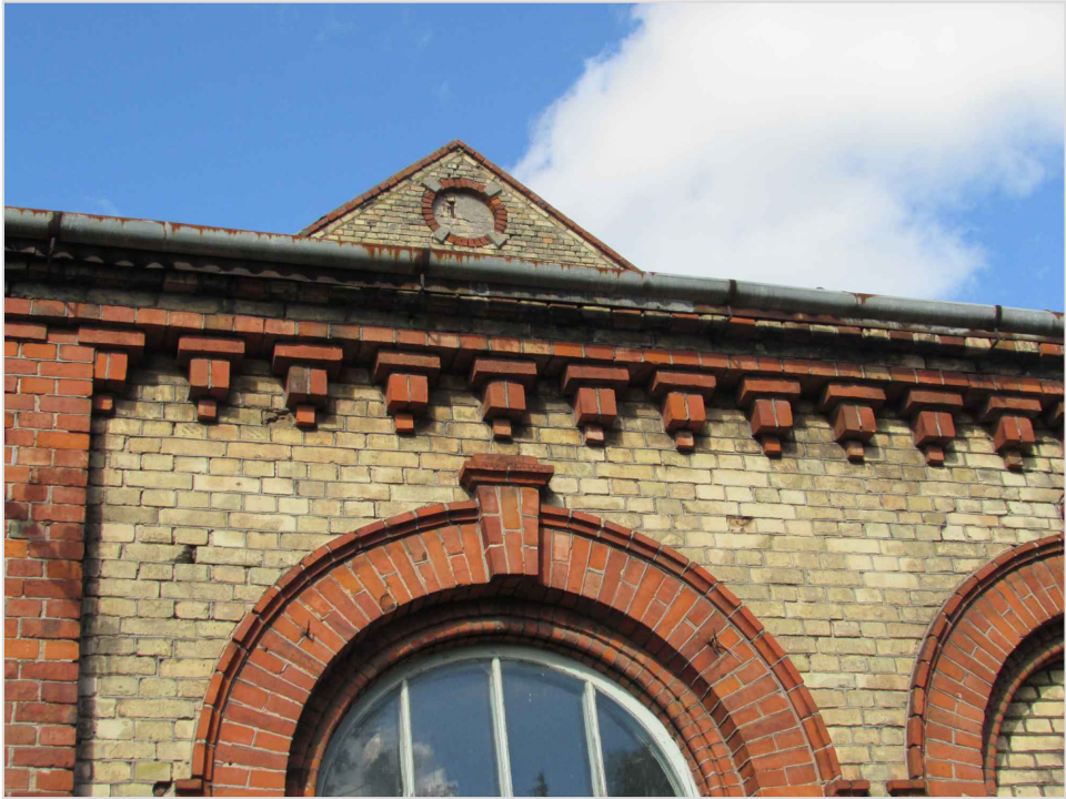
att. 23. Piebūve 6. Dzega.