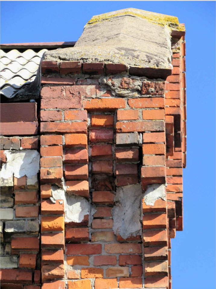
att. 25. Korpuss 1. Stūra pilastra kapitelis .