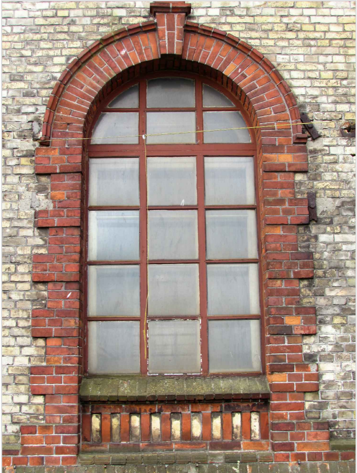
att. 26. Korpuss 4. Loga aillas apdare.