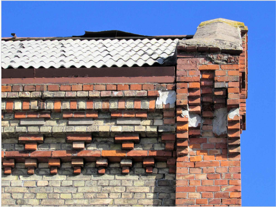
att. 22. Korpuss 1. Stūra pilastra kapitelis un dzega.