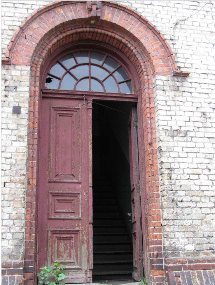
att. 24. Korpuss 1. Galvenās ieejas durvis.